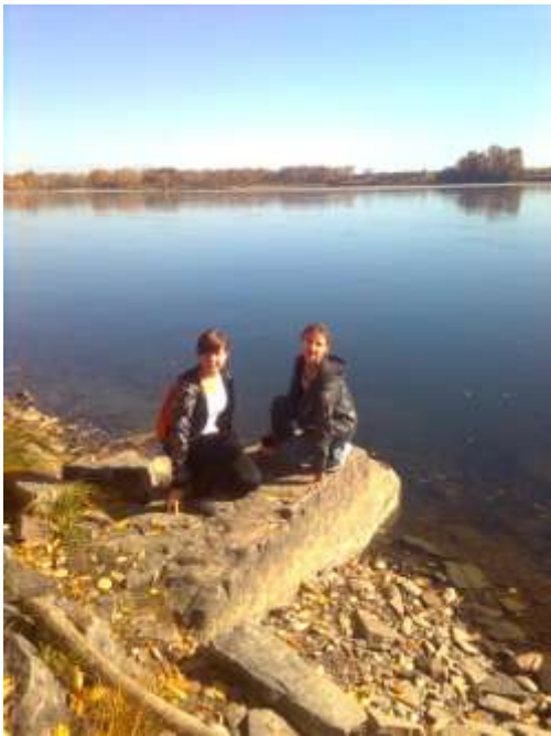
«Am Ufer des Flusses Tuba»